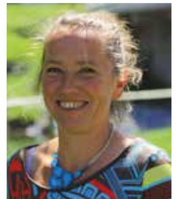
ARTICLE RÉDIGÉ PAR EMMANUELLE DEFFAYET, DIRECTRICE GÉNÉRALE DES SERVICES.

du public ou faisant l'objet d'un aménagement indispensable pour l'exploitation d'un service public sont réputés appartenir au domaine public communal. Les biens des communes qui ne rentrent pas dans cette catégorie constituent le domaine privé communal. ♥