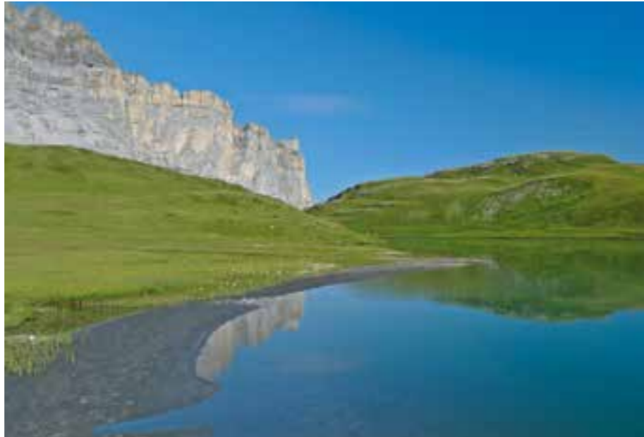
LAC, VALLON D'ANTERNE

Les vallons présents sur la réserve naturelle ont chacun une particularité et un intérêt qui nécessite la mise en œuvre de mesures de protection. Certains secteurs, de par les difficultés d'accès, offrent de grandes zones de tranquillité. ♥