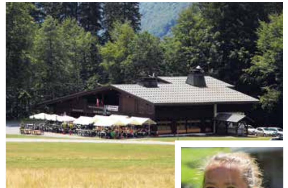
▲ CHALET DU CIRQUE DU FER-À-CHEVAL

De son côté, durant ces deux années, le conseil municipal aura à charge de définir un programme d'investissement à moyen terme pour le camping. Ce programme d'investissement servira de cahier des charges à la prochaine consultation qui portera sur une durée plus importante avec