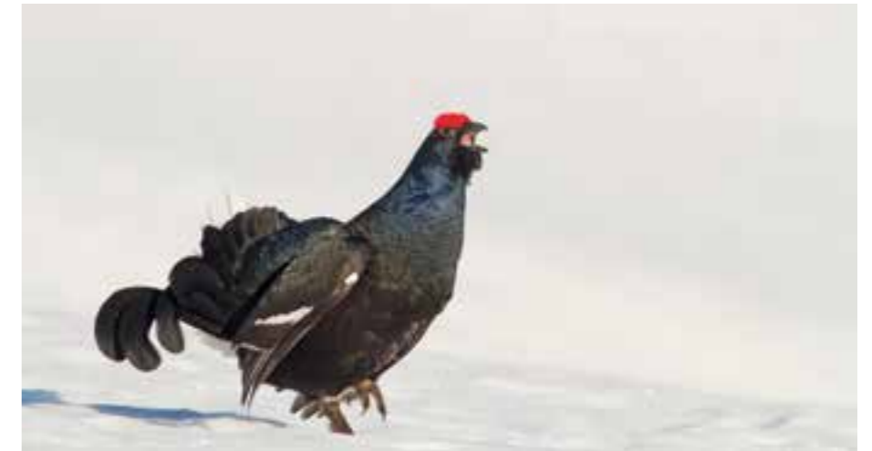
▲ TÉTRAS LYRE MÂLE PARADE

En 2014, en accord avec la Commune, Asters et la SEA ont travaillé sur le projet pastoral d'Anterne. Sur la base d'un projet de nouvelle cabane pastorale sur ce secteur, la réflexion a été élargie à l'ensemble de la conduite pastorale et à une meilleure prise en compte des enjeux de biodiversité (zones humides, pelouses d'altitudes, reproduction du Lagopède alpin).