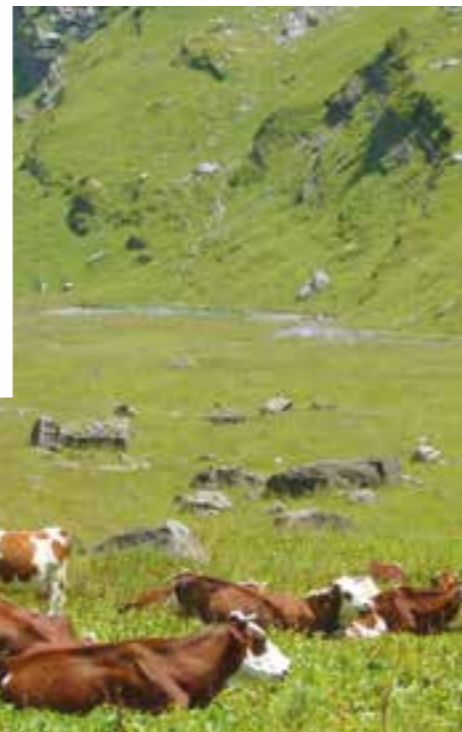
▲ NOS VACHES NE SONT PAS STRESSÉES.

« On fabrique la totalité à Salvadon car c'est trop compliqué de descendre le lait ». Faire pâture les bêtes à l'alpage est pour eux « une conception de l'agriculture de montagne mais aussi une étape obligée car, en bas, les surfaces baissent d'années en années ». Sous le Buet, la quinzaine d'ânesses de Sylvie Dalibard foule cet été l'alpage des Fonts pour la deuxième année consécutive. Cette ancienne infirmière a décidé, en 2011, de vivre de sa passion en créant un élevage d'ânes sardes et de Savoie, deux races du terroir, et ainsi transformer le lait d'ânesse en soins cosmétiques bio. Pour les fabriquer, elle utilise le surplus de lait des ânesses qui allaitent en priorité leur petit. Cela représente 300 litres de lait par an. Installée le reste du temps à Faucigny, sa venue aux Fonts a été pour elle l'opportunité de mettre en pratique l'option qu'elle a choisie au cours de sa formation, à savoir la gestion d'un alpage. « En plus, je peux le faire dans un cadre magnifique ! » ajoute-t-elle. Même son de cloche du côté de Grenairon où, l'année dernière, David et Christelle Raymond ont repris l'alpage inexploité depuis 1969. « On ne regrette pas notre installation ici,