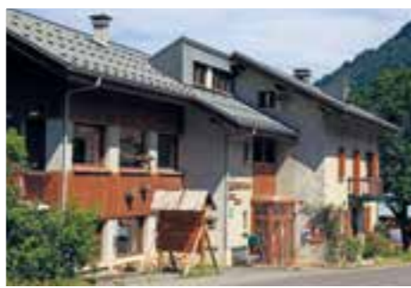
▲ L'AUBERGE DE SALVAGNY

Outre le fait que ces « petits séjournants » d'aujourd'hui seront nos clients de demain, il faut aussi prendre en compte l'importance des centres de vacances pour l'économie du tourisme puisqu'ils soutiennent l'offre économique locale de par leur imbrications avec d'autres acteurs économiques du territoire : épicerie, magasins de souvenirs, de sport, prestataires d'activités