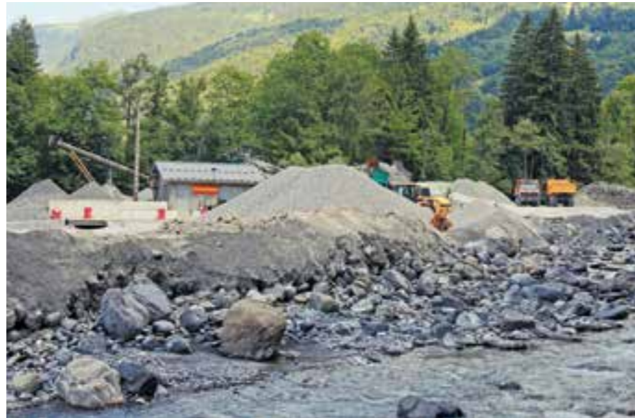
▲ LA SARL BACCHETTI