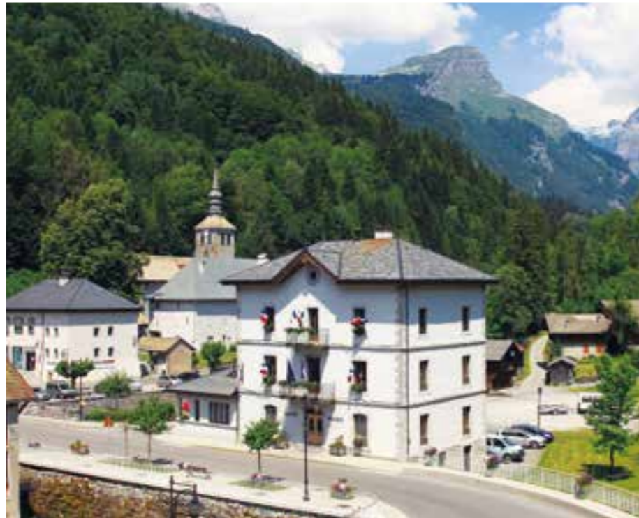
▲ LA MAIRIE, SITUÉE AU CŒUR DU CHEF-LIEU EST LE PASSAGE OBLIGATOIRE POUR TOUS LES ACTES IMPORTANTS DE LA COMMUNAUTÉ.

Suite au départ en retraite d'un commerçant du village et compte tenu d'absence d'initiative privée pour poursuivre l'exploitation de la presse et du point poste, le conseil municipal a choisi de reprendre le flambeau et de maintenir l'activité sur la commune en créant une régie.