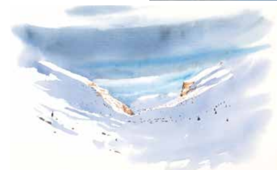
▲ AQUARELLE VALLON DE SALES PAR M. ERIC ALIBERT