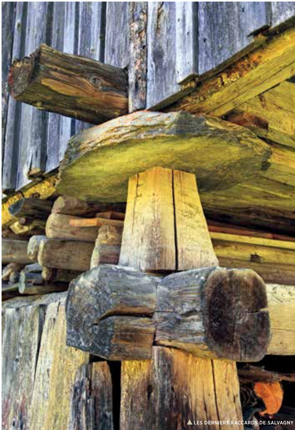
▲ LES DERNIERS RACCARDS DE SALVAGNY

Très certainement d'origine valaisanne où ils s'appelaient de l'autre côté de la frontière, palets ou pilets, les raccards comme on dit chez nous, soutenaient nos greniers pour mettre leurs contenus à l'abri des rongeurs et autres nuisibles. Le dernier grenier sizeret posé sur des raccards se trouve à Salvagny. Nous avons voulu le mettre en valeur avant que le temps ne fasse, un jour, son œuvre.