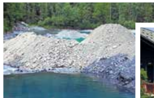
▲ LES PIÈGES À GRAVIER

Ainsi l'exploitant du Chalet du Cirque du Fer-à-Cheval est tenu de rester ouvert au public dans des conditions préalablement prévues au contrat. Il doit assurer à certaines périodes l'entretien de la salle hors-sac située au sous sol du chalet restaurant, il doit également mettre à disposition de ses clients des documents promotionnels de la commune. Enfin il a l'obligation de communiquer à la commune ses comptes et résultats d'exploitation. 🍀